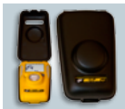
Gehäuse für Ruhezustand