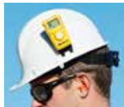
Clip für Schutzhelm